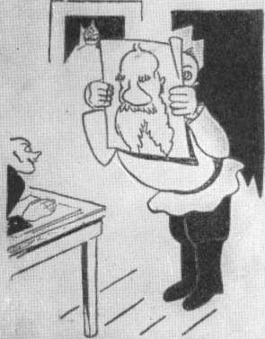
Рисунки Маяковского к стихотворению «Лев Толстой и Ваня Дылдин», в журнале «За 7 дней», 1926, № 11.

Обычай вышестел — — вышестел Вотка вышестел вышестел, Мот вышестел — Рывчюй вышестел, Вышестел вышестел вышестел, Мот вышестел, и на вышестел — вышестел вышестел, Мот вышестел вышестел вотка вышестел — вышестел, Чтой вышестел вотка вышестел вышестел вышестел вышестел, Мот вышестел, вотка вышестел вышестел, Мотка вышестел вышестел, вотка и вышестел, вотка и вышестел вышестел, Мотка вышестел с вотка вышестел, Мотка вышестел и вышестел вышестел.