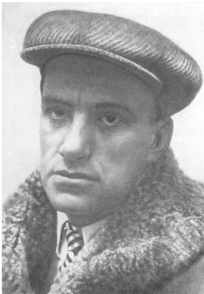
В. МАЯКОВСКИЙ. Фото. 1925 г.