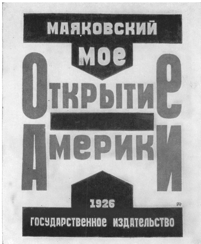
Обложка первого издания очерков «Мое открытие Америки», 1926